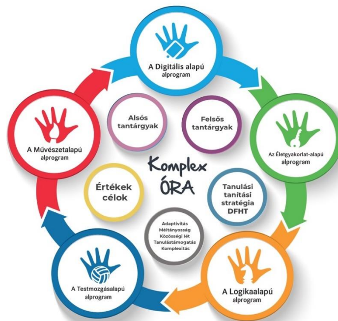
A Komplex órák felépítése